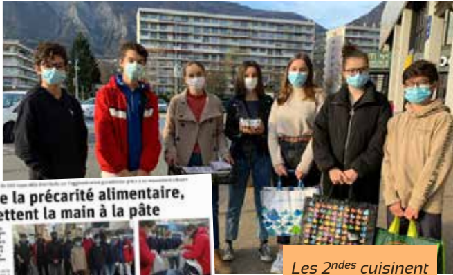
Les 2 ndes cuisinent Pour Eux !