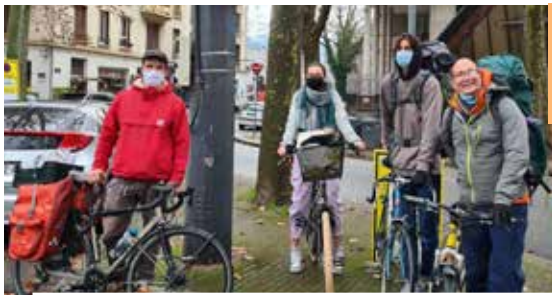
Distribution à vélo des cadeaux de Noël