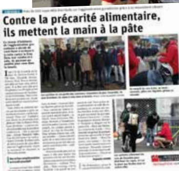
C'est dans le Dauphiné libéré !