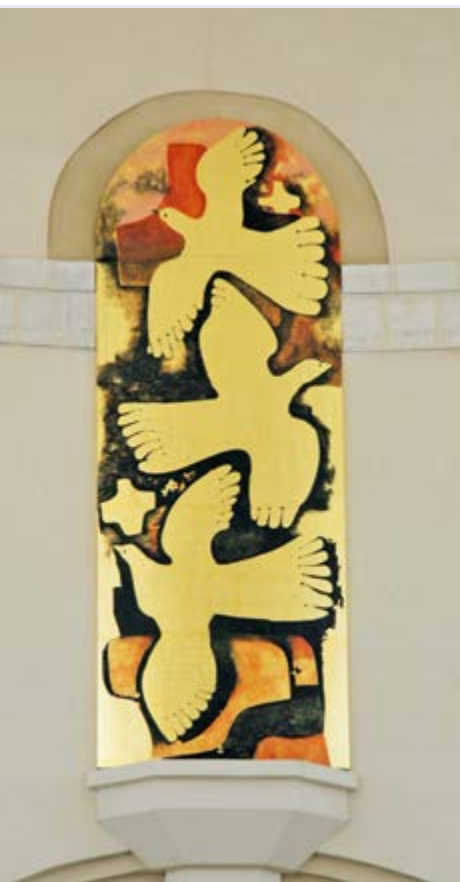
Basilique du Sacré-Coeur

« VIENS, SOUFFLE DE VIE, SOUFFLE DE FEU, SOUFFLE DE DIEU ! »