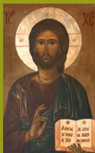
Le Christ pasteur (détail d'icône)