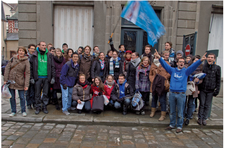
Une quarantaine d'étudiants de différentes écoles et universités grenobloises étaient présents.

Nous entrons dans une démarche de dialogue pour chercher ensemble, pour avancer humblement vers une vérité plus grande, afin que dans vos aumôneries vous