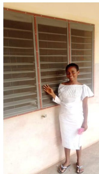
Une jeune fille devant les moustiquaires installées.

L'argent a permis d'installer des moustiquaires aux fenêtres des dortoirs pour lutter contre les moustiques porteurs du paludisme.