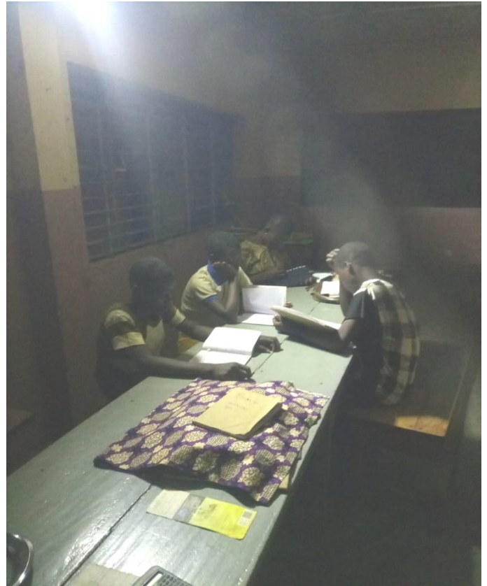
Les jeunes qui étudient le soir grâce aux panneaux solaires fournissant l'électricité.

Achat de panneaux solaires pour le fonctionnement d'un puits.