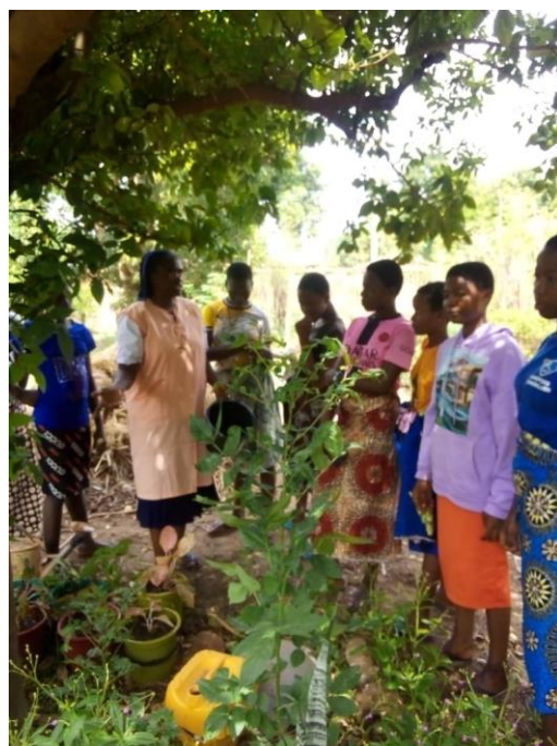
Le temps du jardinage.

Leur mission auprès de la population est importante surtout auprès des femmes pour leur offrir un lieu d'écoute et d'éducation, une aide à l'alphabétisation, à la formation des femmes et des jeunes filles à la cuisine, au jardinage, à la restauration et à la gestion de leurs petits moyens financiers. Tout ceci pour leur permettre d'arriver petit à petit un jour à l'autonomie financière.