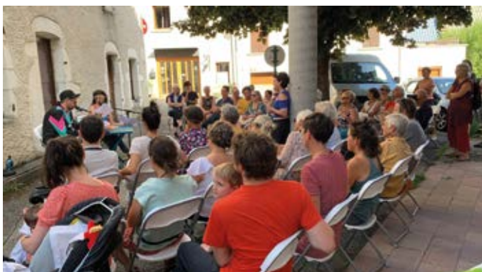
Rencontre de présentation du projet La Cabine.

du lien est au cœur de notre démarche et ce projet nous apparaissait important pour nous-mêmes comme pour le pays. Nous avons un moment imaginé le mettre en place à Echarlière, mais nous sommes beaucoup trop excentrés. Au bourg, ce serait nettement mieux. L'idée reste en sommeil, et il y a un peu plus d'un an, passe l'annonce de la vente d'un local commercial au Clos. Nous le visitons et entrevoyons vite toutes les perspectives qu'il ouvre. Juste à côté des lieux d'animation culturelle, le cinéma le Clos, la bibliothèque, L'Entre-Deux espace d'exposition et de spectacle, le Festival du Film d'Autrans Mais comment faire son acquisition ? Je suis très impliquée dans « Sentiers Communs », une démarche encore peu connue qui regroupe ici les tiers-lieux, espaces de rencontres, d'échanges et de création d'activités pour répondre aux besoins du territoire. Quelques contacts, des messages dans nos réseaux et six-sept personnes se déclarent prêtes à investir financièrement dans le projet ! Une SAS (société par actions simplifiée) est créée et achète le local qui pourra ensuite être loué à l'association gestionnaire du café.