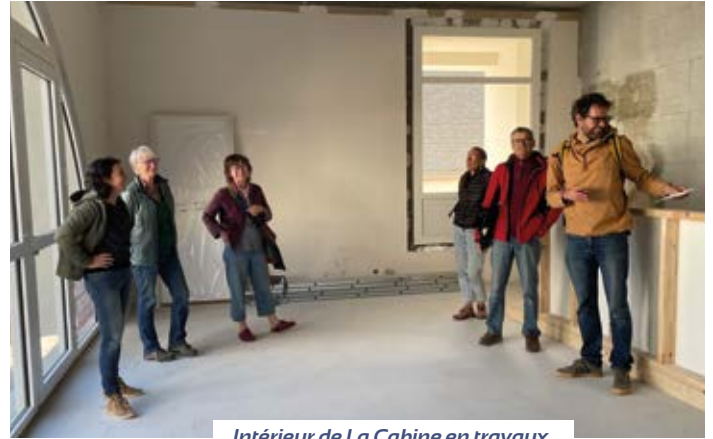
Intérieur de La Cabine en travaux.