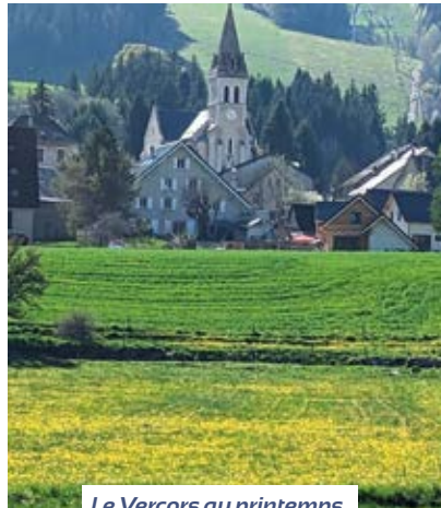
Le Vercors au printemps.

Aujourd'hui en France, la prise en compte du tourisme dans l'évangélisation reste modeste malgré un potentiel immense (100 millions de touristes par an). Sur le Vercors, la population est multipliée par trois en période de vacances, soit près de 40 000 personnes. Comment être plus présent à celles et ceux en interrogation sur le sens de la vie, le beau et le bon ?