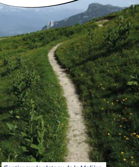
Sentier sur le plateau de la Molière.