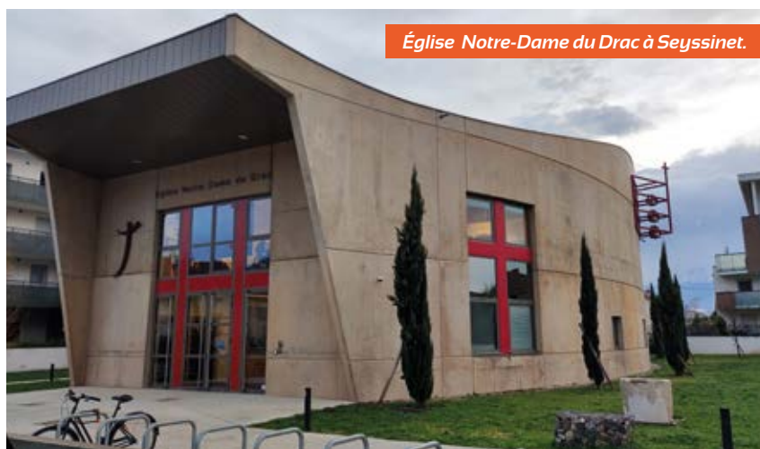
Église Notre-Dame du Drac à Seyssinet.