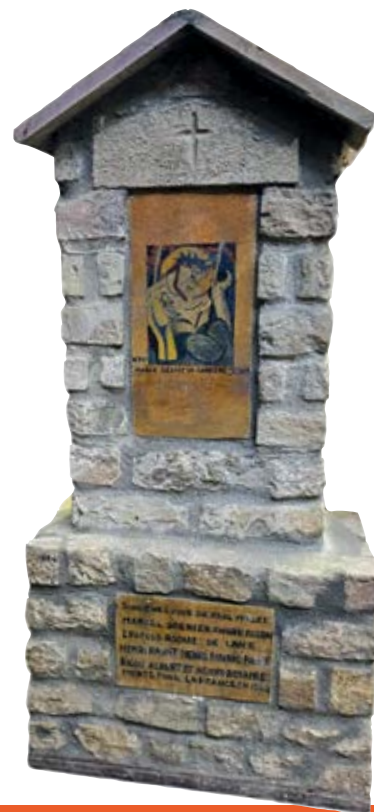
Les reproductions de Jean-Pierre Depetro

En 2012, il achève ses maquettes, et parce qu'il cherche à les exposer, en remet une partie au musée de la Résistance de Vassieux. En 2024, La Maison du Patrimoine de Villard-de-Lans, organisant une exposition consacrée à ce chemin de croix, présente au public pour la première fois une de ces maquettes. Par la suite, ce sont cinq maquettes entreposées dans la cave du musée de Vassieux qui sont récupérées