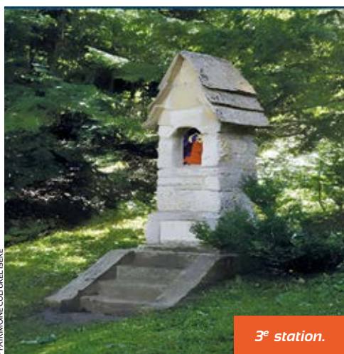
3 e station.