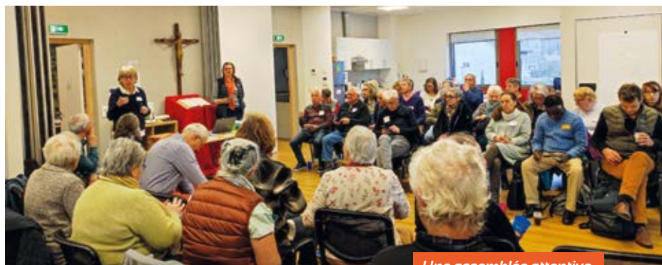
Une assemblée attentive.

Qu'est-ce qu'un doyenné ? C'est un regroupement de paroisses. Le nôtre en compte trois: Saint-Martin du Néron, Notre-Dame du Drac et La Croix de Valchevrière, dont les prêtres référents se réunissent régulièrement, parfois avec les équipes paroissiales.