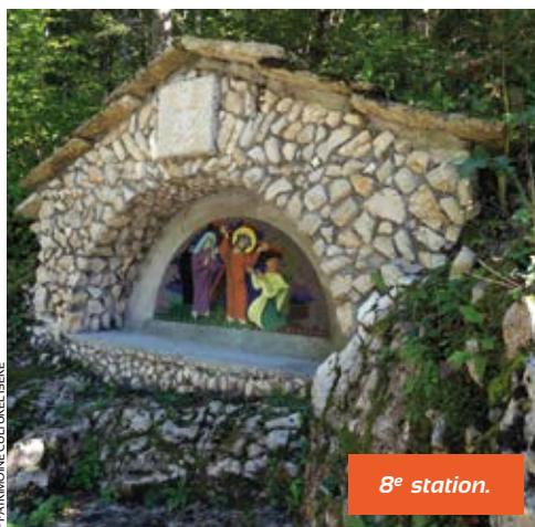
8 e station.