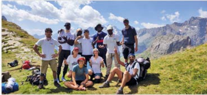
Les JRS, à retrouver sur le site: jrsfrance.org/isere

Camp de montage organisé chaque été par l'entente entre paroisses locales et exilés !