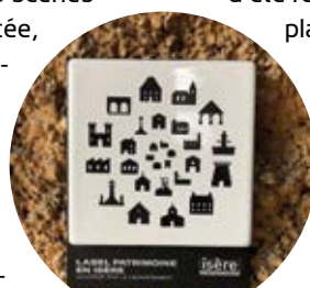
Plaque du label Patrimoine en Isère

Le 23 mai dernier, une plaque signalétique du label « Patrimoine en Isère » a été remise par le département et placée au pied de la haute croix d'aluminium qui surmonte la station 12 sur la terrasse aménagée du belvédère. Ce label affirme que les treize stations et la chapelle constituent, comme cent-vingt-cinq autres sites labellisés en Isère, un patrimoine d'intérêt départemental et qu'il existe un engagement