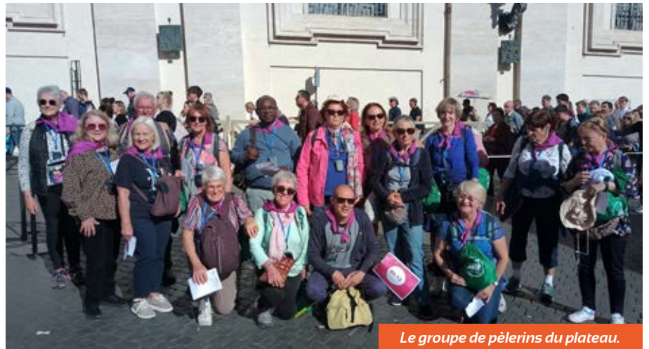
Le groupe de pèlerins du plateau.