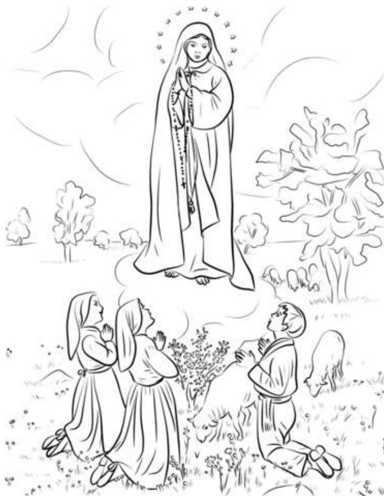
Notre-Dame de Fátima (Portugal)

Le Samedi 9 Mai 2026 la Communauté Portugaise et la Paroisse St-Joseph des Deux-Rives commémorent l'Apparition de la Vierge à Fátima.