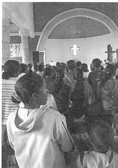
Église d'Amboanjobe une heure avant la messe