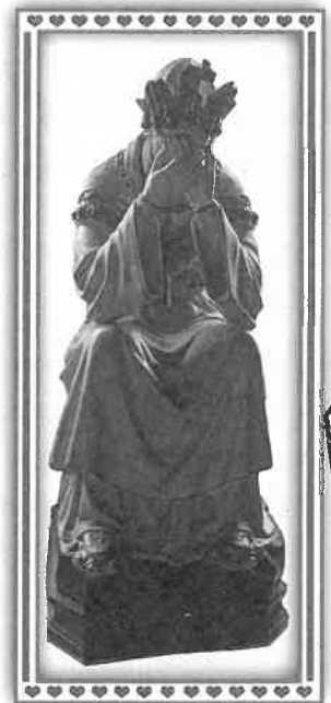
Statue de Notre-dame de la Salette d'Amboanjobe

Nous étions le 25 décembre dans l'église Notre-dame de la Salette d'Amboanjobe et j'avais presque l'impression d'être retourné dans le diocèse de Grenoble quand je regardais les statues présentes dans l'église.