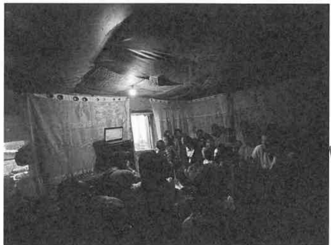
Le fameux karaoké

La fête se poursuivait par ... un karaoké auquel nous participâmes avec joie car nous étions désormais habitués à l'exercice. Je ne saurais vous conter la fin de cette fête car nous sommes rentrés vers 17h et que celle-ci a continué jusqu'au soir et s'est poursuivie toute la journée du lendemain. Nous avons été honorés de participer à ce bel événement car 50 ans de mariage ce n'est pas si commun que cela. C'est un très beau témoignage de vie et nous étions très heureux d'y participer. Nous avions presque l'impression de faire partie de la famille. J'avoue cependant qu'après avoir enchaîné trois fêtes en quatre jours, je commençais à être un peu fatigué et que je fus heureux de prendre un peu de repos avant que les cours ne reprennent.