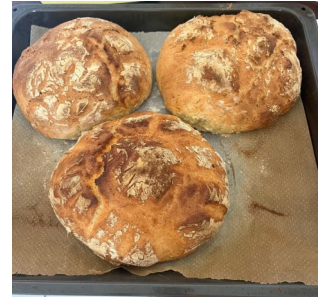
Les enfants ont fabriqué leur pain pour découvrir le pouvoir du levain