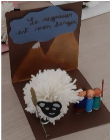
Le bon berger ramène la brebis égarée