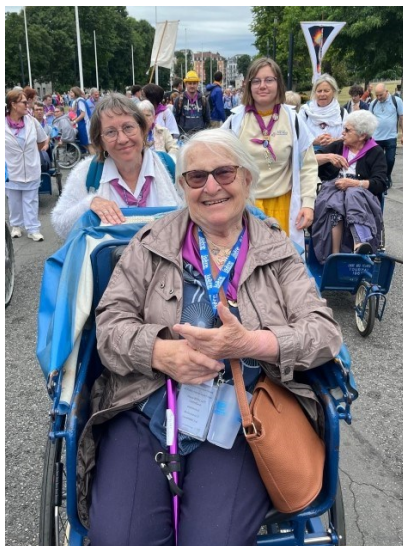
La joie, l'un des miracles de Lourdes

lies entre elles... Ici, les quelques larmes de tristesse ne durent jamais longtemps ; les larmes d'émotion ne manquent pas ; et surtout, on rit et on sourit beaucoup, on chante et on prie !