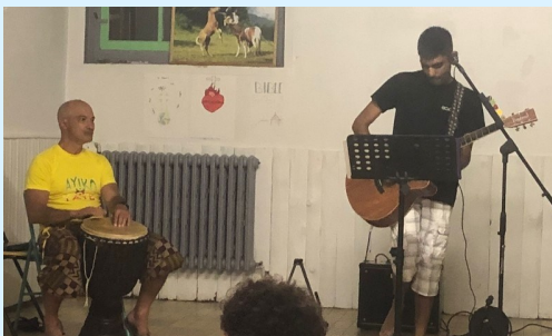
Enoch était chargé de l'animation musicale du camp