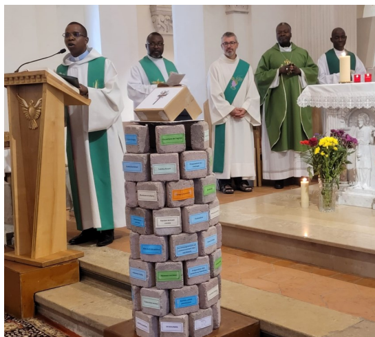
Au premier plan : les services de la paroisse, autant de pierres qui construisent l'Eglise

Dès le début de la célébration a été annoncé le thème de cette année paroissiale : « Rencontrer Jésus dans toutes les pauvretés », invitation à se laisser toucher par la présence du Christ dans la vie de chacun et à se faire proche des plus pauvres, quelle que soit la nature de leur pauvreté. Puis les différents services de la paroisse ont été mis à l'honneur avec la construction de la tour des services . Au cours de son homélie, l'archevêque nous a exhortés avec simplicité pour toucher nos cœurs et rejoindre nos