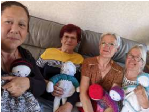
Une partie du groupe "Prière des Mères" de St-Hilaire-du-Rosier

- "Prière des Mères" : A 15h00, à St-Hilaire-du-Rosier, chez D. Boffard (06 80 01 37 19) - Temps de Prière : A 18h00, à L'Albenc (Eglise).