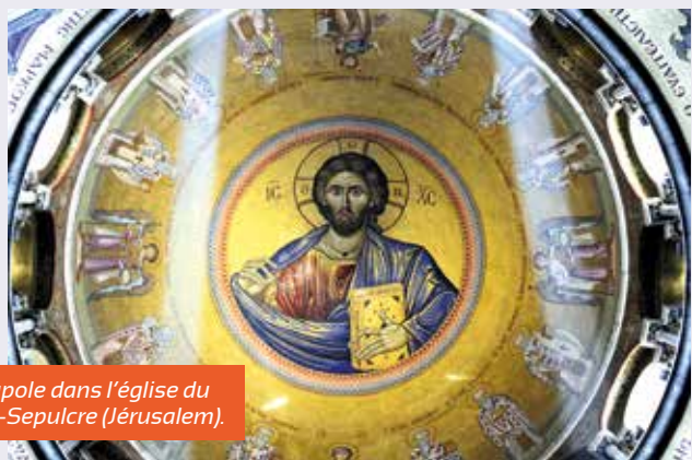
Coupole dans l'église du Saint-Sepulchre (Jérusalem).

» La paix est un bien précieux, objet de notre espérance auquel aspire toute l'humanité. Les terribles épreuves des conflits marquent pour longtemps le corps et l'âme de l'humanité. La paix est un édifice « sans cesse à construire » en cherchant toujours le bien commun. Il nous faut vivre le pardon et être des hommes de paix. On n'obtient pas la paix si on ne l'espère pas. La paix est toujours possible... Que se lève une nouvelle aube d'espérance et de paix!