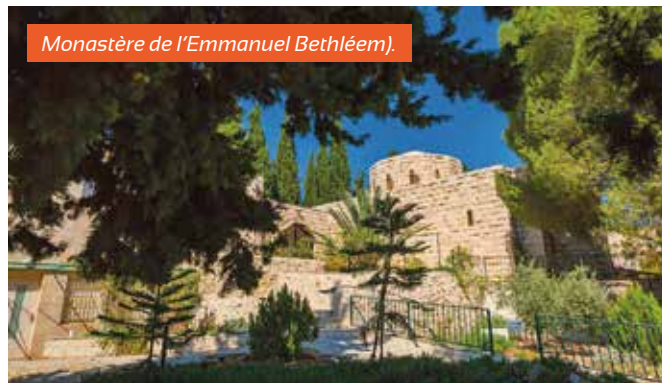
Monastère de l'Emmanuel Bethléem).

Notre temps n'est pas celui de Dieu. L'espérance c'est demander la grâce de garder au cœur de l'épreuve, de la souffrance, de l'isolement, du rejet, le regard sur Jésus qui a traversé tout cela pour nous. Demander la grâce d'une joie profonde au cœur de la difficulté car nous ne sommes pas seuls pour vivre, surmonter, affronter nos épreuves.