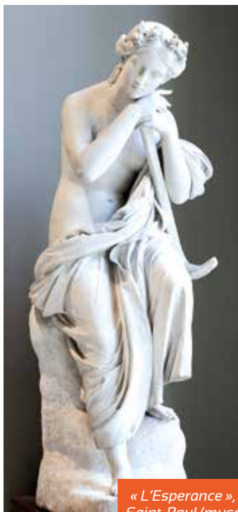
« L'Espérance », de Lemoyne Saint-Paul (musée du Louvre).

» Dans l'Ancien Testament, Dieu se fait connaître en appelant les humains à entrer dans une relation avec lui : il établit une alliance avec eux. La Bible définit les caractéristiques du Dieu de l'Alliance par deux mots : « amour » et « fidélité ». Ces mots disent que Dieu est bonté et bienveillance débordante pour les siens et qu'il n'abandonnera jamais ceux qu'il a appelés à entrer dans sa communion. C'est la source de l'espérance biblique, quelles que soient les difficultés, elles ne peuvent être définitives. Dans leur foi en Dieu, les croyants puisent l'attente d'un monde selon la volonté, l'amour de Dieu. Dans la Bible cette espérance est souvent exprimée par la notion de promesse d'une vie plus grande. Cela commence par Abraham : « Je te bénirai, dit Dieu, et par toi se béniront toutes les familles de la Terre. » (Genèse 12,2-3) Une promesse est une réalité dynamique qui regarde vers l'avenir et s'enracine dans une relation à Dieu qui me parle et m'appelle à faire des choix concrets dans ma vie.