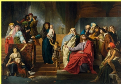
François-Joseph Navez | L'obole de la veuve , 1840

Le 20 juin s'est tenue une soirée spéciale sur le thème de "L'argent dans l'Église" avec le Père Benoît. Cette ressource, omniprésente dans nos vies, a été abordée dans une perspective chrétienne afin de nous donner des pistes pour l'intégrer pleinement à notre existence conformément à l'Évangile.