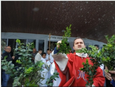
Dimanche des Rameaux

https://www.facebook.com/photo/?fbid=237035585365188&set=pcb.23703592203182