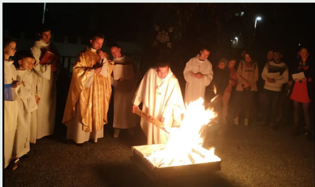
Veillée Pascale (1 / 2)

https://www.facebook.com/photo/?fbid=239902555078491&set=pcb.2399034450784