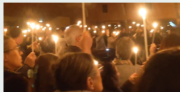
Veillée Pascale (2 / 2)

https://www.facebook.com/photo/?fbid=240557335013013&set=pcb.240557748346305