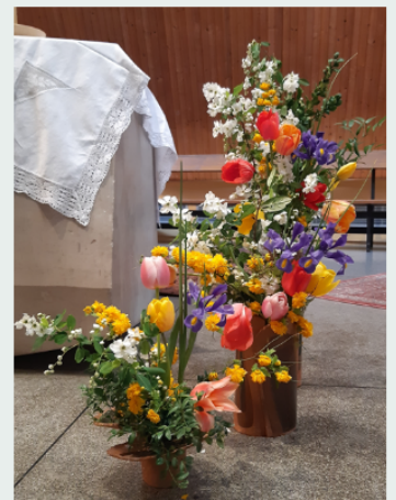
Dimanche de Pâques