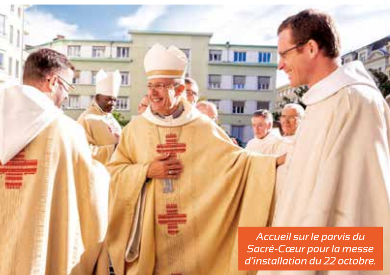
Accueil sur le parvis du Sacré-Cœur pour la messe d'installation du 22 octobre.