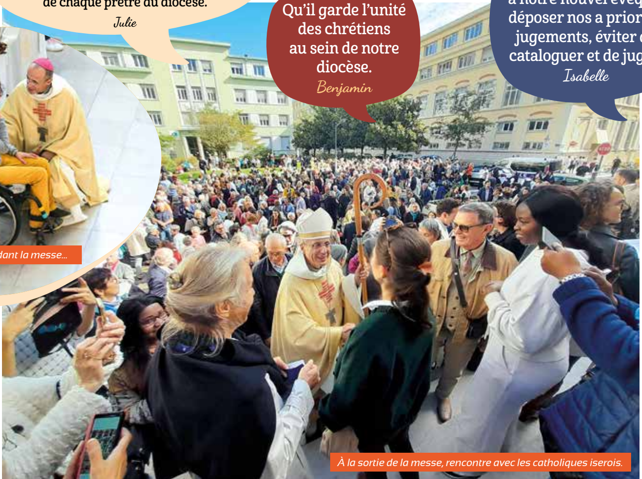
À la sortie de la messe, rencontre avec les catholiques isérois.