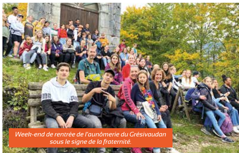
Week-end de rentrée de l'aumônerie du Grésivaudan sous le signe de la fraternité.