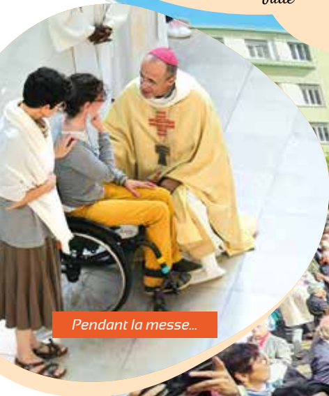
Pendant la messe...