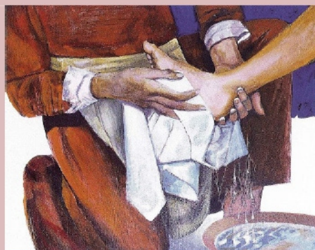
Le lavement des pieds - Arcabas

L'entraide matérielle mais aussi la relation d'amour constituent la solidarité