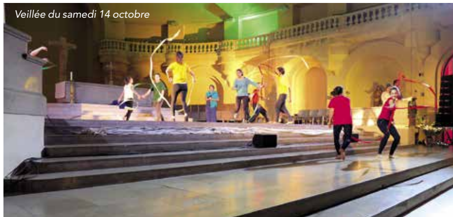
Veillée du samedi 14 octobre

Ensuite, nous, les jeunes, avons été parti-