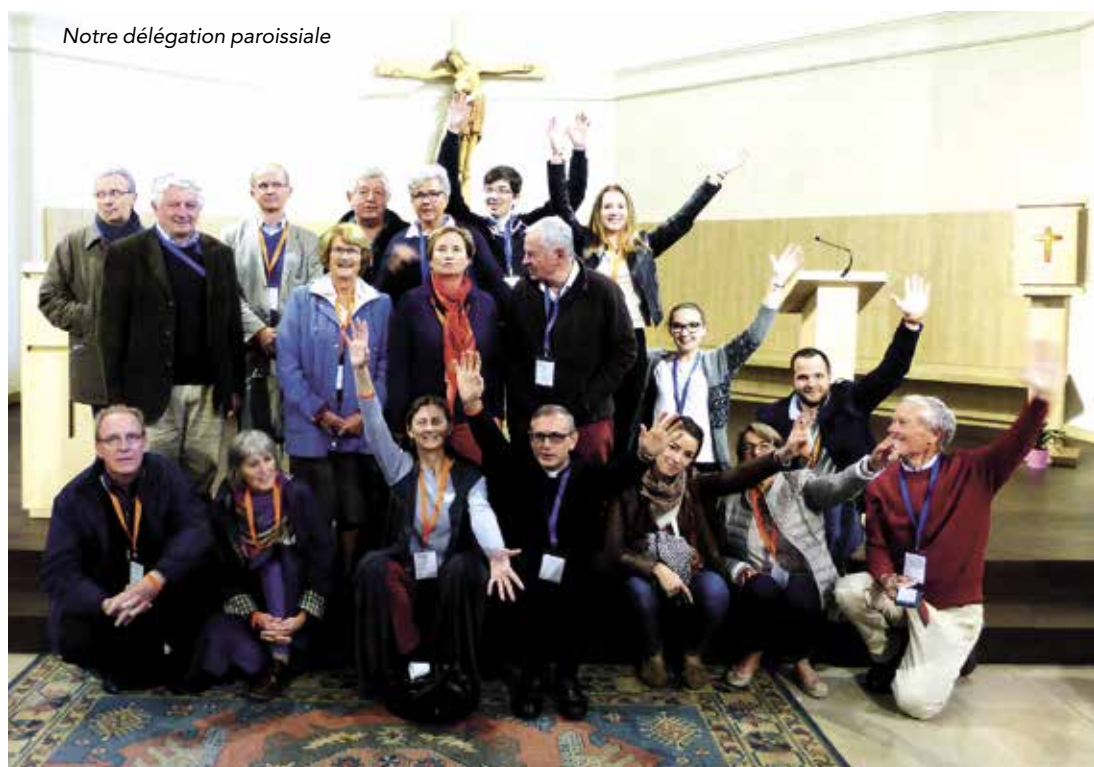
Notre délégation paroissiale

Prenant du recul, chaque délégation s'est réunie pour identifier les joies, les