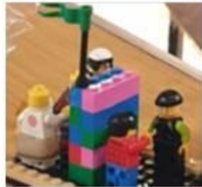
Cloison psychologique entre paroissiens

Un débat : le tabernacle est-il à placer dans l'église ou est-il en dehors ? (dans nos cœurs)