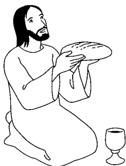
Le Saint Sacrement

Avec règles sanitaires (masques obligatoires et gel hydroalcoolique à l'entrée).