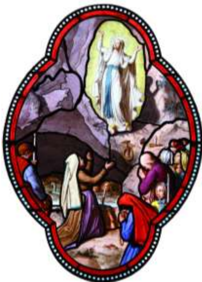
SNDL Photo P.Vincent