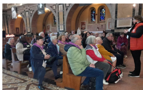
Visite guidée de la basilique

Après l'accueil à l'Ermitage où nous avons séjourné, nous avons pu visiter le Carmel, le mémorial, la chaise émouvante de Sainte Thérèse, la cha-