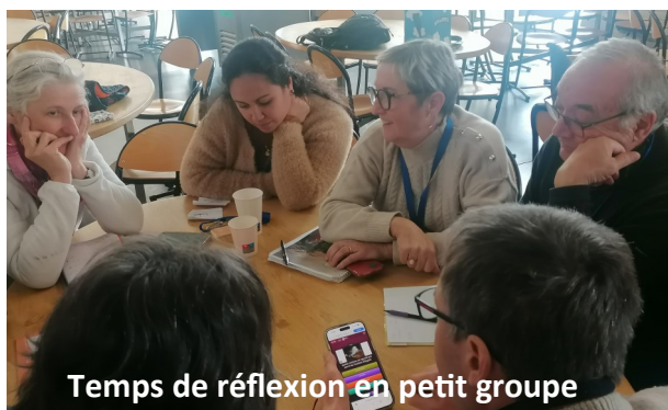
Temps de réflexion en petit groupe

Le 29 novembre, les prêtres et les équipes paroissiales de notre doyenné se sont réunis à Villefontaine pour une fructueuse journée de concertation.