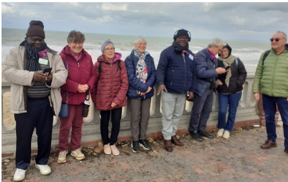
Les membres de l'équipe du MCR à Cabourg

Nous étions une soixantaine de participants, de tout âge, il y avait des familles avec des enfants, les seuls qui ont dormi dans le bus !