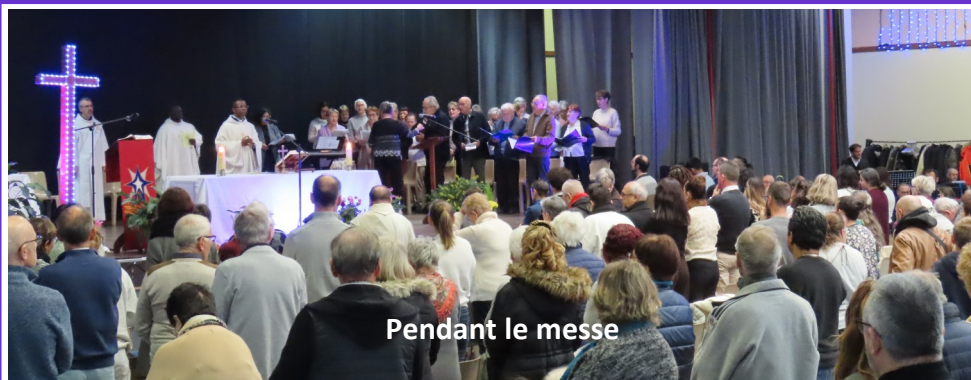
Pendant le messe

Le dimanche 24 novembre, la paroisse Sainte Blandine s'est rassemblée à l'espace pontois de Pont-de-Chéry pour sa kermesse annuelle. Une bien belle journée où l'enthousiasme, l'émotion et le partage furent au rendez-vous.