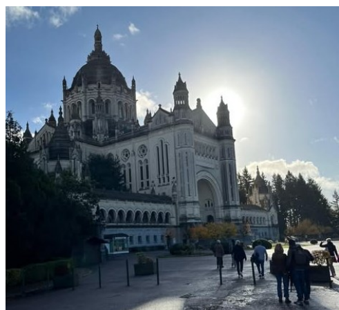
Le groupe arrive devant la basilique de Lisieux

Après une nuit un peu difficile dans le bus nous sommes arrivés à Alençon, la ville où est née Sainte Thérèse. A Alençon nous avons surtout découvert la vie de Louis et Zélie Martin : parents de Sainte Thérèse récemment canonisés. Ils avaient tous les deux désiré entrer dans les ordres, mais Louis ne connaissait pas le latin, et Zélie était de santé fragile, c'est donc en fondant une famille qu'ils ont choisi de servir Dieu. Ils ont eu neuf enfants : quatre décéderont en bas âge et les cinq filles restantes sont toutes devenues religieuses (Thérèse était la petite dernière).