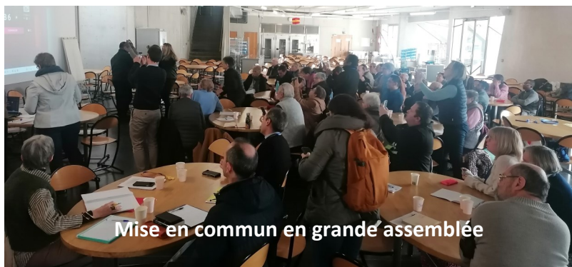
Mise en commun en grande assemblée