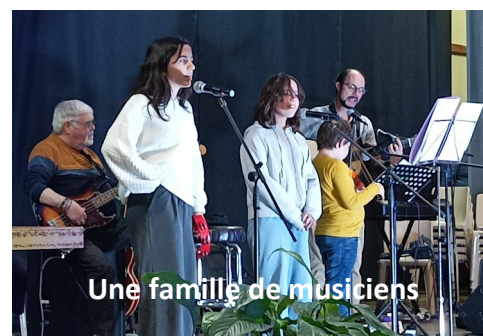
Une famille de musiciens