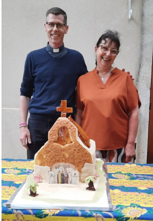
La remise des cadeaux : maillots de football, digigraphie, icône... et, cerise sur le gâteau, cette église, chef d'œuvre d'une pâtissière