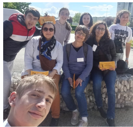
Les jeunes de l'aumônerie et leurs accompagnatrices, à Villette