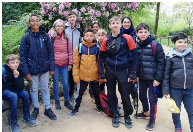
Les plus jeunes en repérage dans le parc

« C'était formidable, ces jeunes au milieu de nous, ça faisait chaud au cœur. Merci à eux, ils m'ont appris beaucoup de choses. »