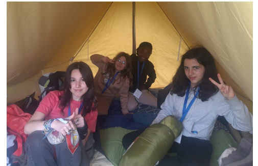
Une nuit sous la tente

Deux journées avec le Seigneur, les ados de nos paroisses et d'autres communautés. Le tout encadré par des animateurs vraiment exceptionnels ! Deux jour-