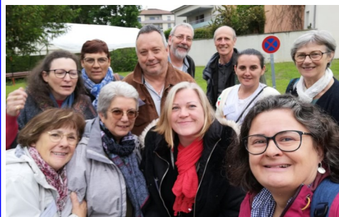
L'équipe missionnaire, avant son départ pour Tignieu