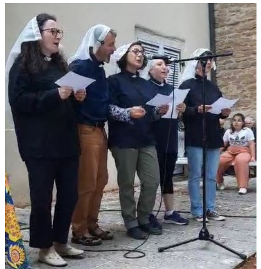
« Merci et au revoir », en paroles et en chanson