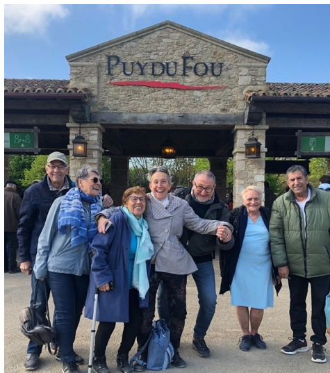
20 avril, l'arrivée au Puy-du-Fou

Du 20 au 24 avril, une cinquantaine d'entre vous ont participé au pèlerinage paroissial au Puy-du-Fou puis à Nevers, où Bernadette Soubirous vécut de 1866 à 1879. Nous vous partageons les échos reçus de quelques participants.