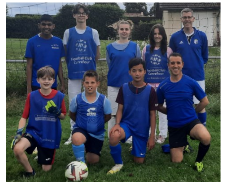
Football : les deux équipes en lice