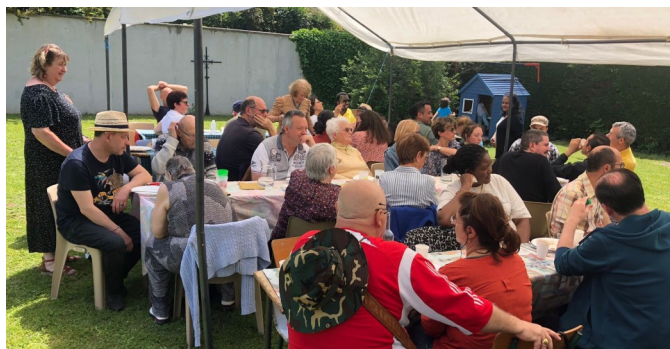
L'heure du repas en plein air

C'est toujours une joie de se retrouver durant ces repas partagés où l'on