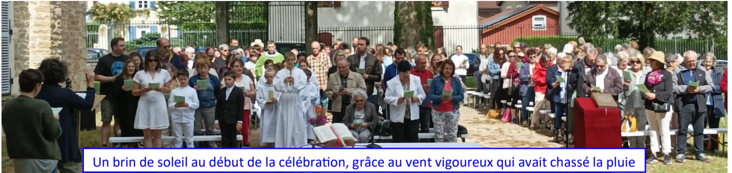
Un brin de soleil au début de la célébration, grâce au vent vigoureux qui avait chassé la pluie