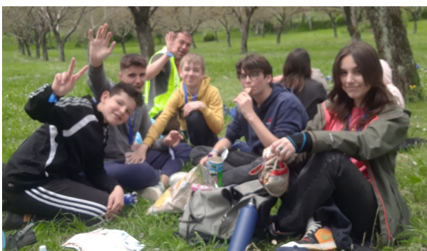
Déjeuner sur l'herbe