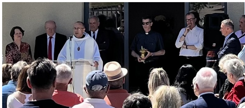
L'évêque le jour de l'inauguration

La cure Saint-Martin est un très beau lieu dans lequel nous pourrions servir joyeusement nos frères et sœurs et partager à tous le trésor de l'Evangile. Nous pourrions partager des moments