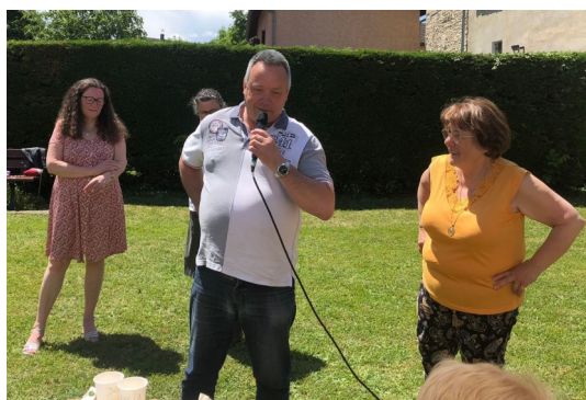
Le témoignage des missionnaires