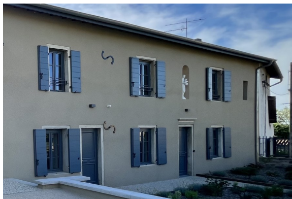
La cure Saint-Martin, toute rénovée

Le 25 mai, la cure de Villette-d'Anthon, toute rénovée, a été inaugurée par le maire et bénie par notre évêque. Dès septembre, ses salles pourront notamment accueillir l'Oasis (le caté nouvelle formule).