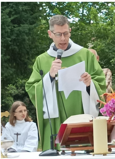
Mon cœur est plein de gratitude