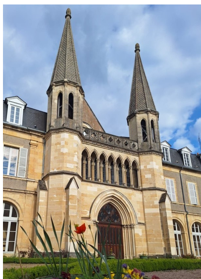
A Nevers, la maison des filles de la Charité