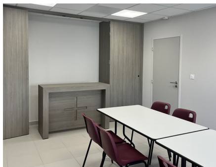
Une des deux salles réservées à la paroisse

ainsi qu'un magnifique jardin engazonné et arboré ... le tout sous le regard protecteur de la Vierge Marie, dont une statue de Vierge à l'Enfant orne la niche de façade.